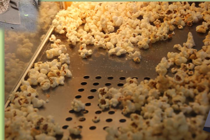
Kino mit Popcorn aus der Popcornmaschine